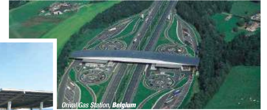
Orival Gas Station, Belgium