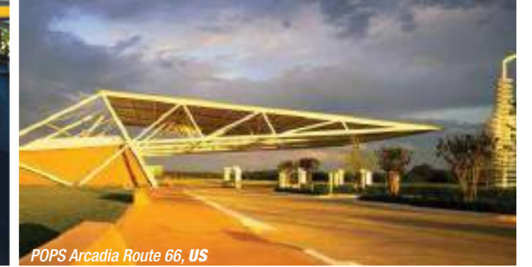
POPS Arcadia Route 66, US