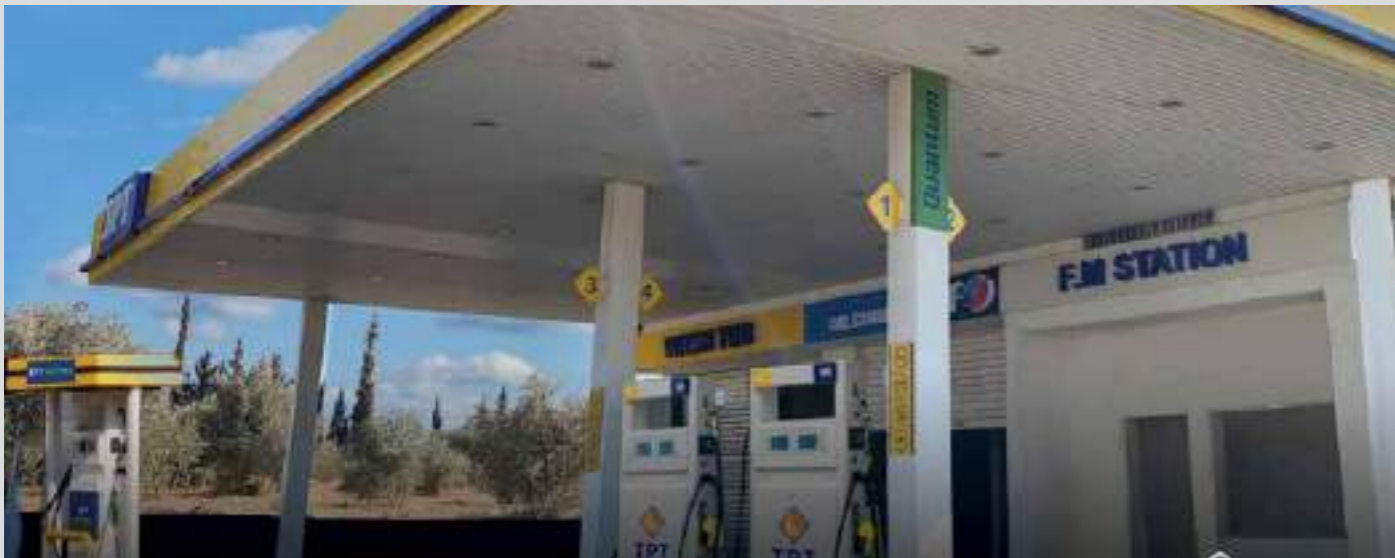
محطة F.M - مجدليا (زغرتا)، لصاحبها فرشخ ومعوض