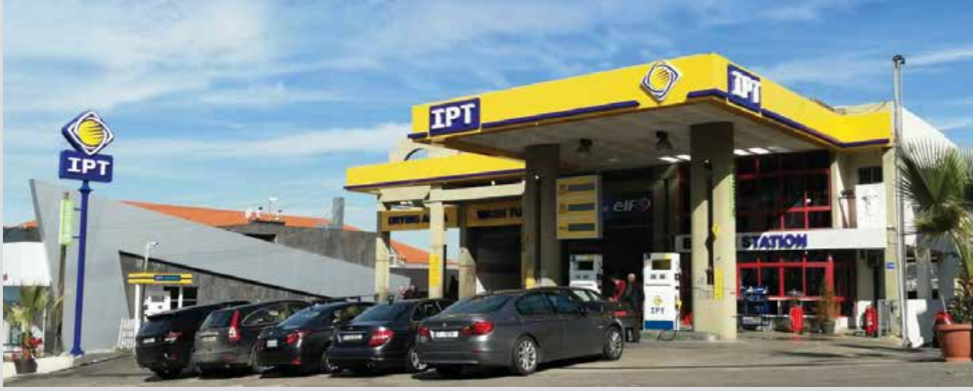
محطة بصاليم - بصاليم (المتن)، بإدارة الشركة

ضمن استراتيجية توسيع خريطة إنشارنا في لبنان، ورغم جميع التحديات، تعرّف مع أي بي تي من خلال هذه الفقرة الثابتة على المحطات الجديدة التي انضمت إلى شبكة محطاتنا فيستسى لكم زيارتها ومشاركتنا آرائكم وتجربتكم.