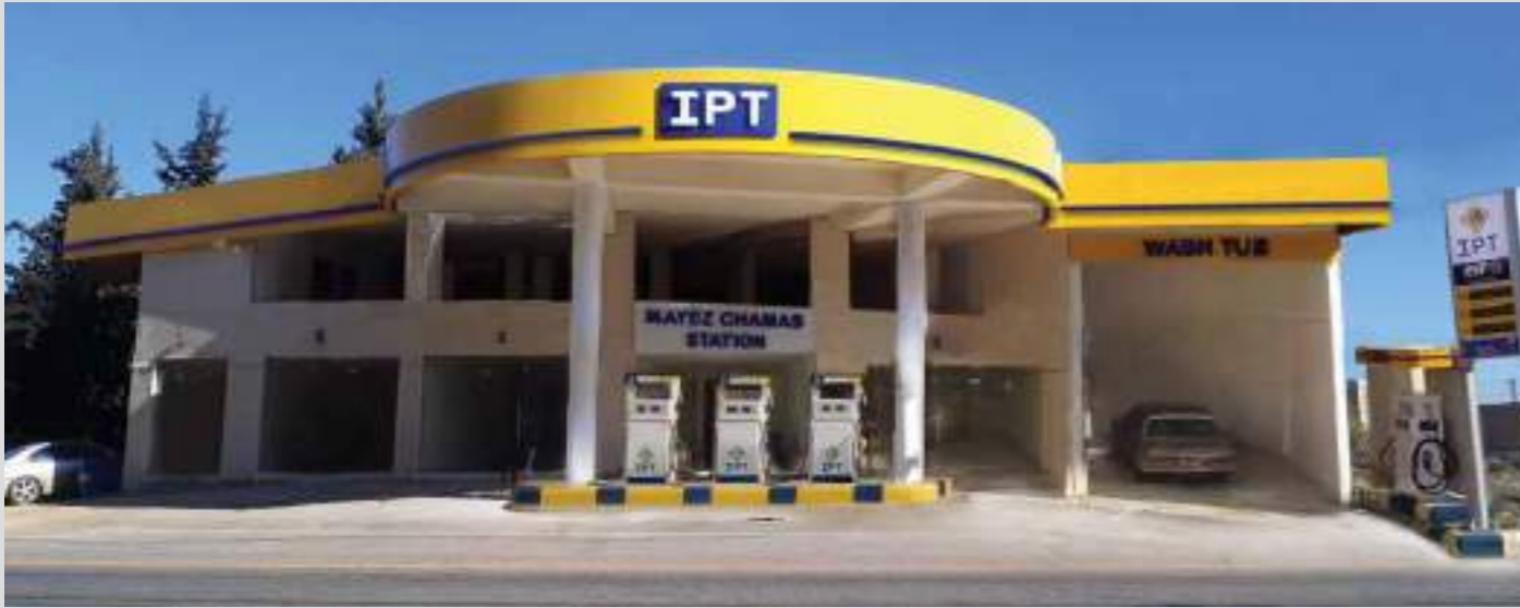
محطة مايز شمس - بوداي (بعلبك)