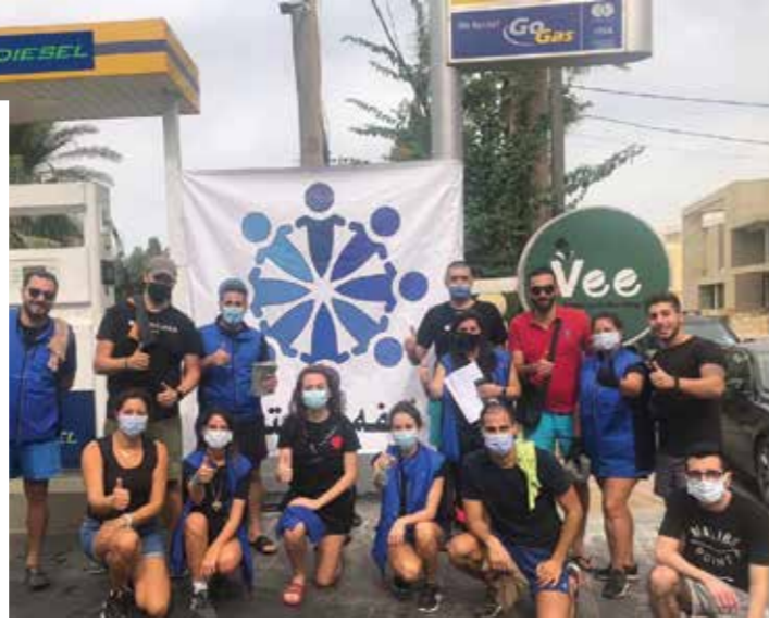
عدد من المتطوعين على محطة أي بي تي - أنفة

مختلفة كان آخرها نشاط "أنفة عيلتنا"، المتلازم مع الأزمة الإقتصادية التي تواجه الشباب اللبناني اليوم.