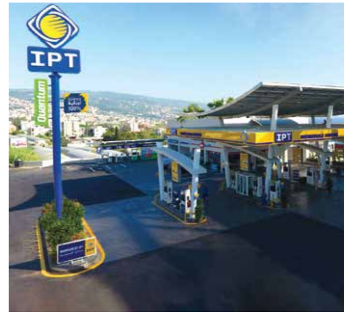
محطة أي بي تي المستدامة والصديقة للبيئة - أوتستراد عمشيت

تعرف على محطات الوقود الأكثر جمالاً حول العالم، وتصاميمها المميزة في الولايات المتحدة وفنلندا وإنكلترا ومختلف البلدان.