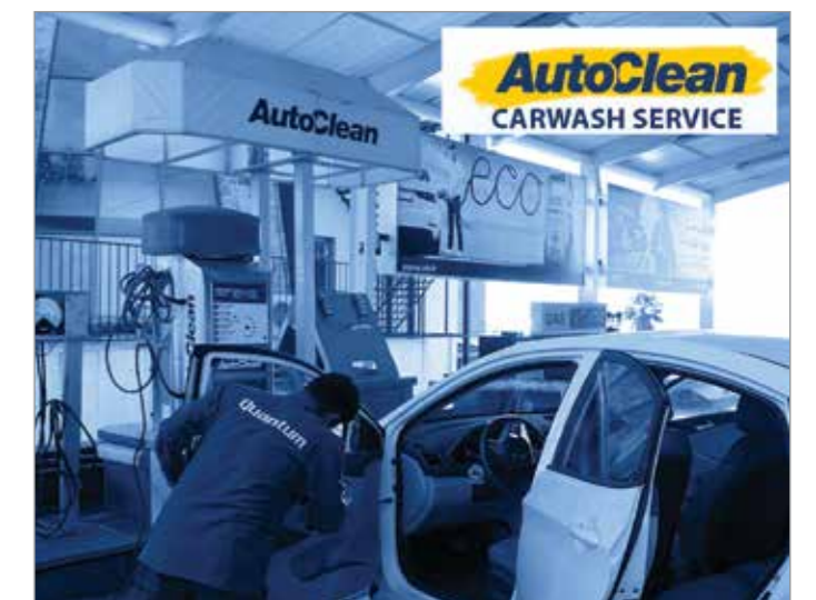
محطة أي بي تي في حالات